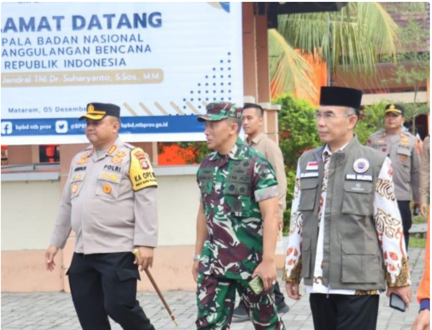
Kapolresta Mataram (Kiri) saat menghadiri acara Peletakan batu Pertama pembangunan gedung Pusdalops BPBD NTB, Kamis (05/12/2024)